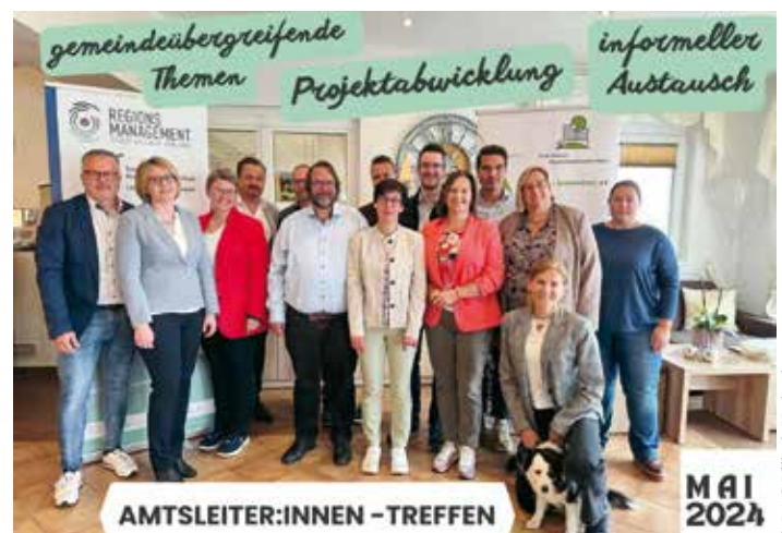
Teilnehmer:innen des 3. Amtsleiter:innen-Frühstücks