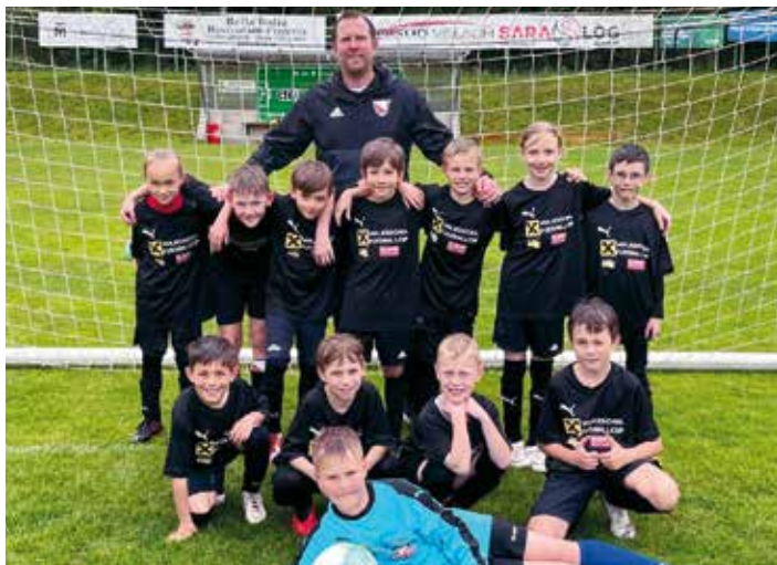
Auch heuer durften wir wieder in der Vorrunde des Raiffeisen Volksschul-Fußballcups 2024 in Arnoldstein mitspielen.