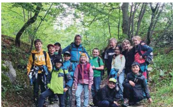
Im Mai fahren alle Klassen zum „Tag der Artenvielfalt“ nach Villach. Vielen Dank an den Naturpark Dobratsch für die Einladung. So macht Wissensvermittlung Spaß.