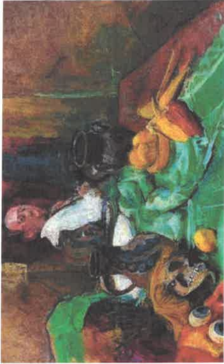
Anton KOLIG, Stilleben mit Maske und Spiegelporträt, um 1940, Kunstsammlung des Landes Kärnten/MMKK, Foto: Graphisches Atelier Neumann, Wien