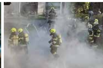
Drehleiterbergung der verletzten Person aus dem