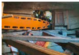
Startender Innenangriff eines Atemschutztrupps

zahlreiche Herausforderungen – von eingeschränkten Zufahrts- und Aufstellmöglichkeiten über die schwierige Zugänglichkeit des Kirchturms bis hin zu den weitläufigen Innenräumen. Solche Übungen sind ein wichtiger Bestandteil, um für den Ernstfall bestmöglich vorbereitet zu sein.