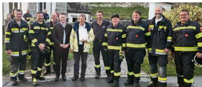
Bergungsarbeiten mit Atemschutztrupp im Kirchturm