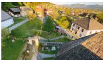
Blick auf Außenangriff vom Kirchturm aus

Am Freitag, dem 24. April 2026, fand in der Marktgemeinde Nötsch im Gailtal bei der Pfarre Saak eine groß angelegte, gemeindeübergreifende Einsatzübung statt. Übungsannahme war ein Brandereignis in der Kirche mit mehreren vermissten