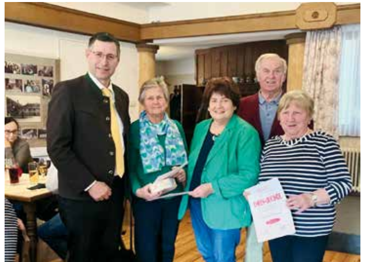
Einige der Geehrten, Frühlingsfest beim Foith

Ende April fand die obligate Fahrt nach Tarvis statt. Zuerst ging man shoppen in den bekannten Markt und im Anschluss auf eine gute italienische Jause zum Dawit.